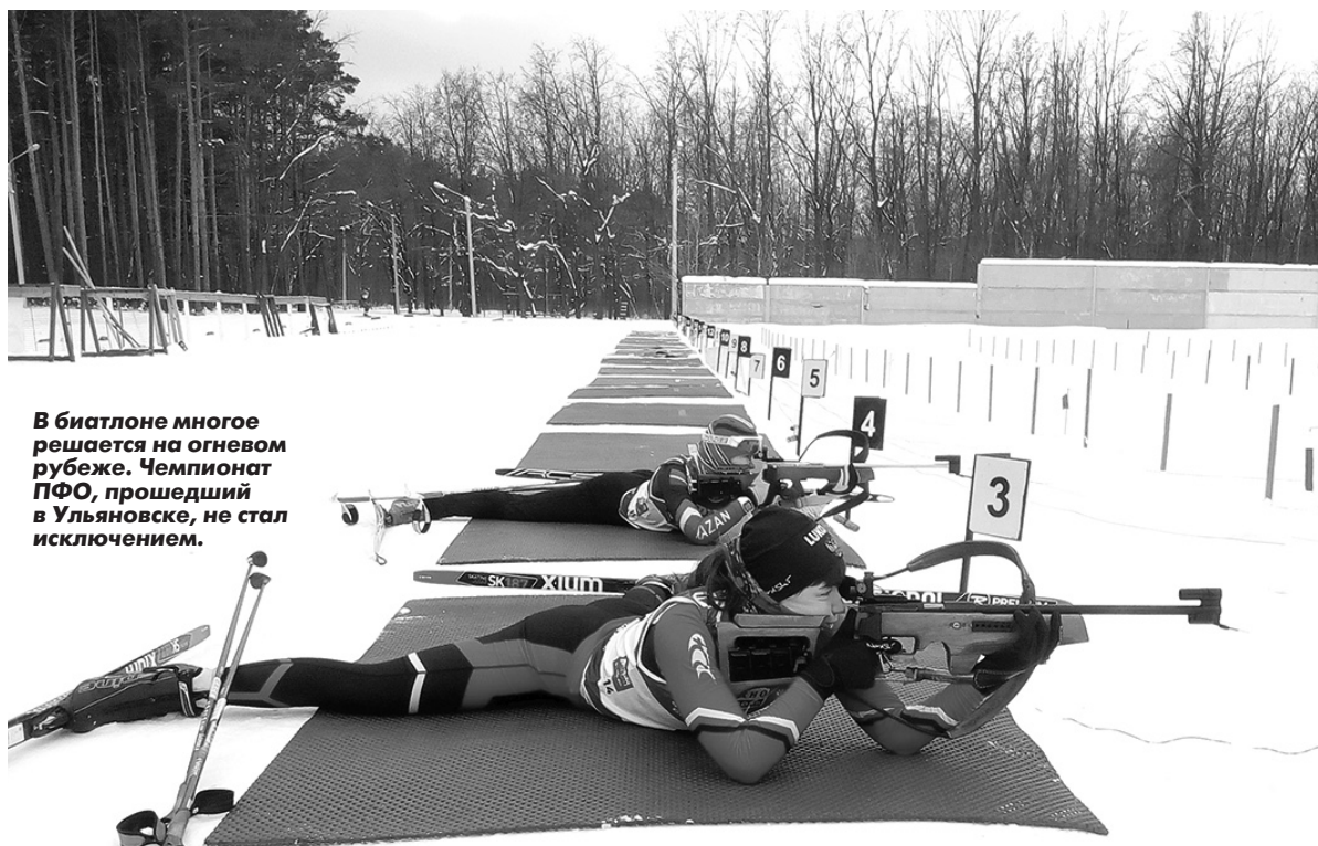
В биатлоне многое решается на огневом рубеже. Чемпионат ПФО, прошедший в Ульяновске, не стал исключением.

Теперь биатлонная база «Заря-УлГУ» готовится в очередной раз принять первенство России среди ветеранов. Оно пройдет в конце февраля.