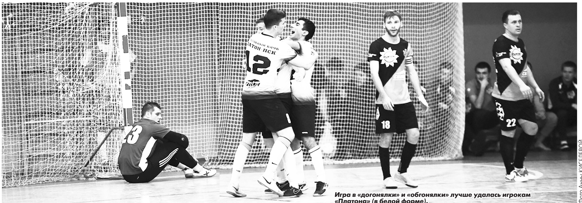
Игра в «догонялки» и «обгонялки» лучше удалась игрокам «Платона» (в белой форме).