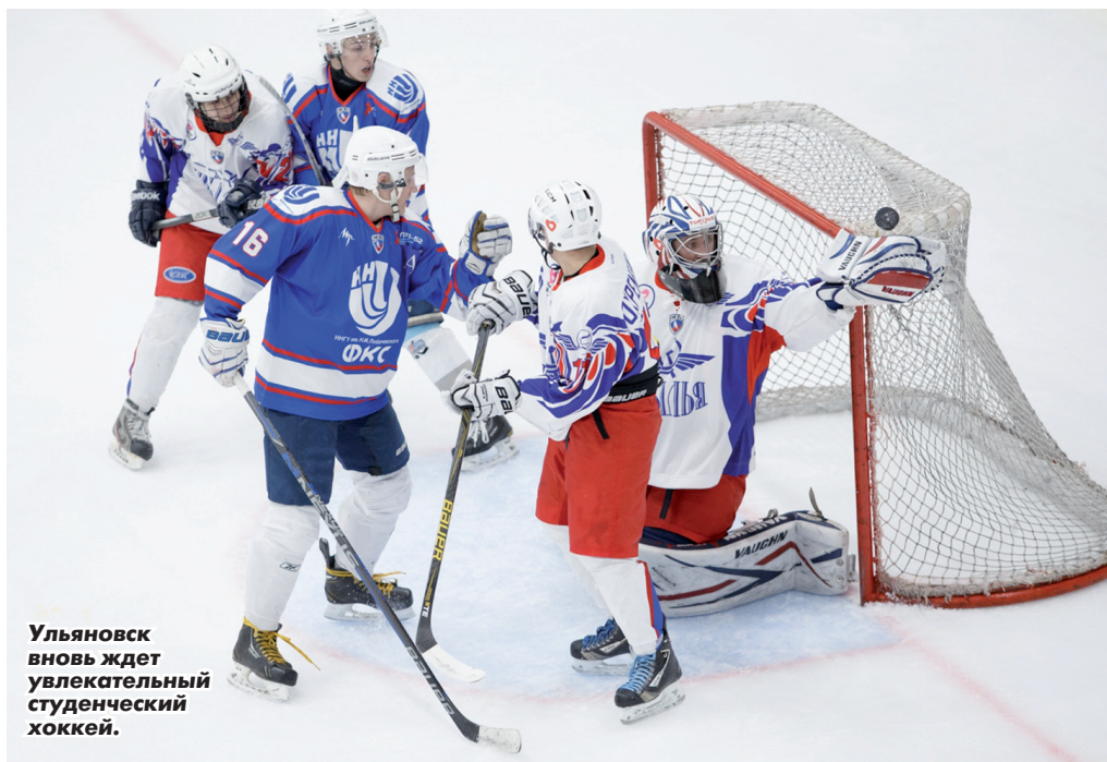
Ульяновск вновь ждет увлекательный студенческий хоккей.

Зато «Крылья» хорошо усилили оборону, которая по предыдущему сезону не была их сильнейшей линией. Ряды